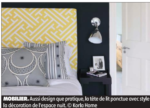
MOBILIER. Aussi design que pratique, la tête de lit ponctue avec style la décoration de l'espace nuit.

Design, classique ou conçu de nos propres mains façon do-it-yourself , cet objet doit apporter confort et style à la pièce. Pour faire le bon choix, on prendra soin d'opter pour un modèle suffisamment haut mais peu imposant au niveau du volume, surtout si l'on dispose d'une petite chambre.